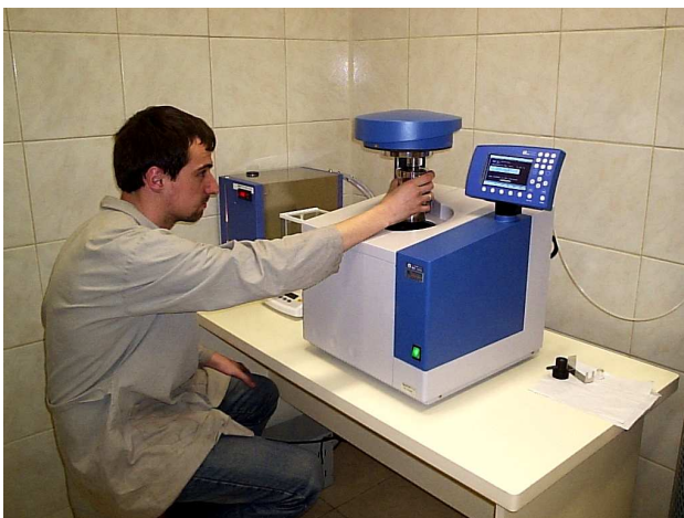
Figura 3. Laboratórios equipados através dos Projetos de P&D.

Onde PCL (kcal/kg) é o poder calorífico líquido e TU é o teor de umidade na base úmida (%).