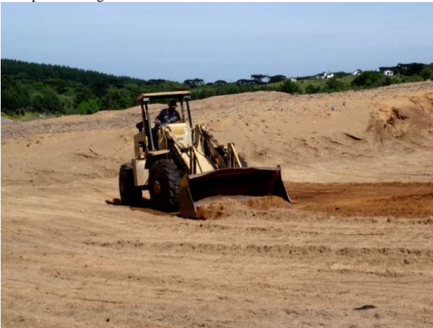
Figura 2. Resíduos industriais (mais de 10 anos de estocagem-2005). Usados para geração de energia (2005-2008).