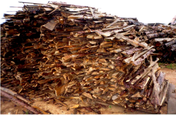
Figura 1. Experimento de estocagem da biomassa para melhoria do desempenho energético.